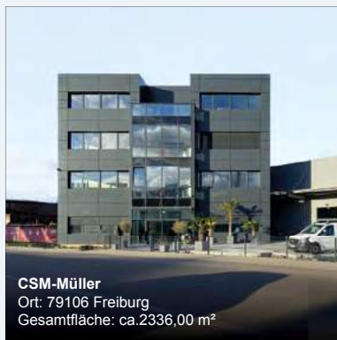
CSM-Müller Ort: 79106 Freiburg Gesamtfläche: ca. 2.336,00 m 2

Die wichtigste Leistung erbringen wir unserem Kunden gegenüber bereits beim Vorgespräch: Wir hören aufmerksam zu.