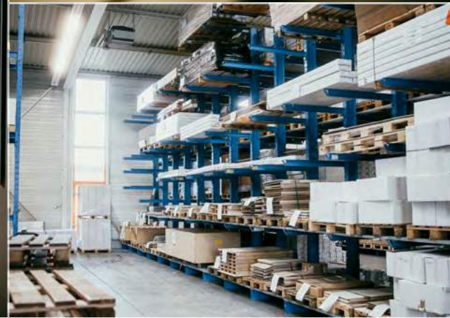
Kork hat viele positive Eigenschaften und behält sie auch in lackiertem Zustand: Fußwärme, Lärm- und Brandschutz, antibakterielle Wirkung, Eignung für Allergiker und Wasserresistenz.