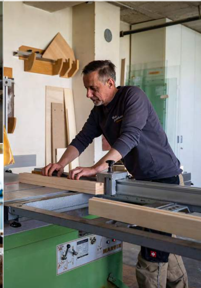
Werkbank, Hobel, Schleifmaschine, Mustertafeln verschiedener Saunahölzer und mehr – hier entstehen Schwitzbäder für zuhause.

system stärken und das vegetative Nervensystem stabilisieren. Laut einer aktuellen Studie aus Schweden schüttet der Körper beim Schwitzen in der Sauna das Glückshormon Endorphin aus.