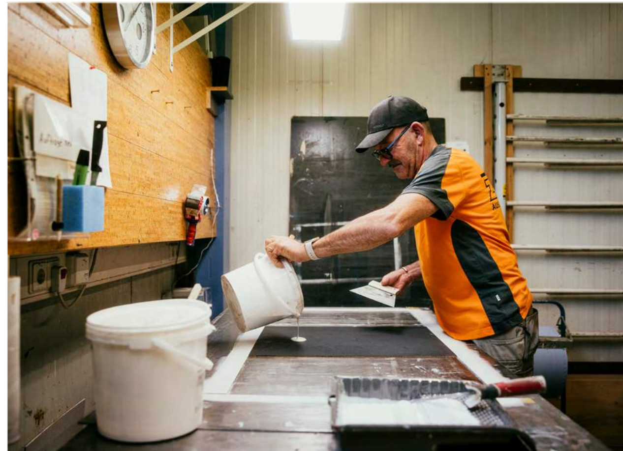
Zipse lässt von einem portugiesischen Partnerunternehmen produzieren und konfektioniert in Kenzingen Korkparkett oder -fliesen nach Kundenwunsch.

Die Rinde wächst immer nach. Der erste junge Kork eignet sich nur als Dämmmaterial oder Schwimmkork für die Fischerei. Hochwertigeren Kork für Weinflaschen oder auch Bodenbeläge liefern Bäume, die mindestens 50 Jahre alt sind. Korkeichen können mehrere hundert Jahre alt werden. Aus 30 Prozent der geernteten Baumrinde werden Flaschenkorken, der Rest wird anderweitig verarbeitet. Weil Korkeichen nicht gefällt werden, schneidet der aus ihrer Rinde gewonnene Dämmstoff klimatechnisch deutlich besser ab als Holz. Zudem hat Kork zahlreiche positive Eigenschaften, die er sogar in lackiertem Zustand behält. Das angenehm warme Gefühl für die Füße zum Beispiel, den Lärm- und Brandschutz, die antibakterielle Wirkung und Eignung für Allergiker sowie die Wasserresistenz.