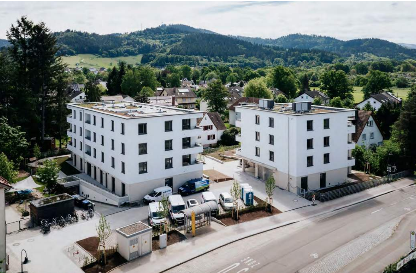
Neubauprojekt des Bauvereins Breisgau in Gundelfingen. In dem Komplex sind 24 Wohnungen und ambulant betreute Wohngemeinschaften untergebracht.

Der Bauverein Breisgau präsentiert eine gute Jahresbilanz und zeigt sich optimistisch für die künftige Entwicklung. Gründe für das positive Ergebnis und die gute Stimmung sind gestiegene Spareinlagen, aktuelle Bauprojekte und Impulse aus der Politik.